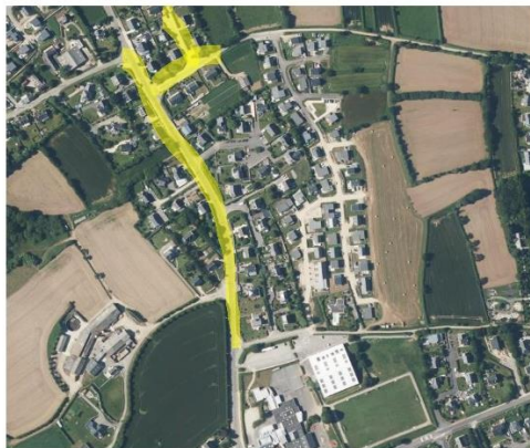
Le tracé en jaune correspond à la zone des travaux

Travaux préparatoires à partir du lundi 4 décembre .